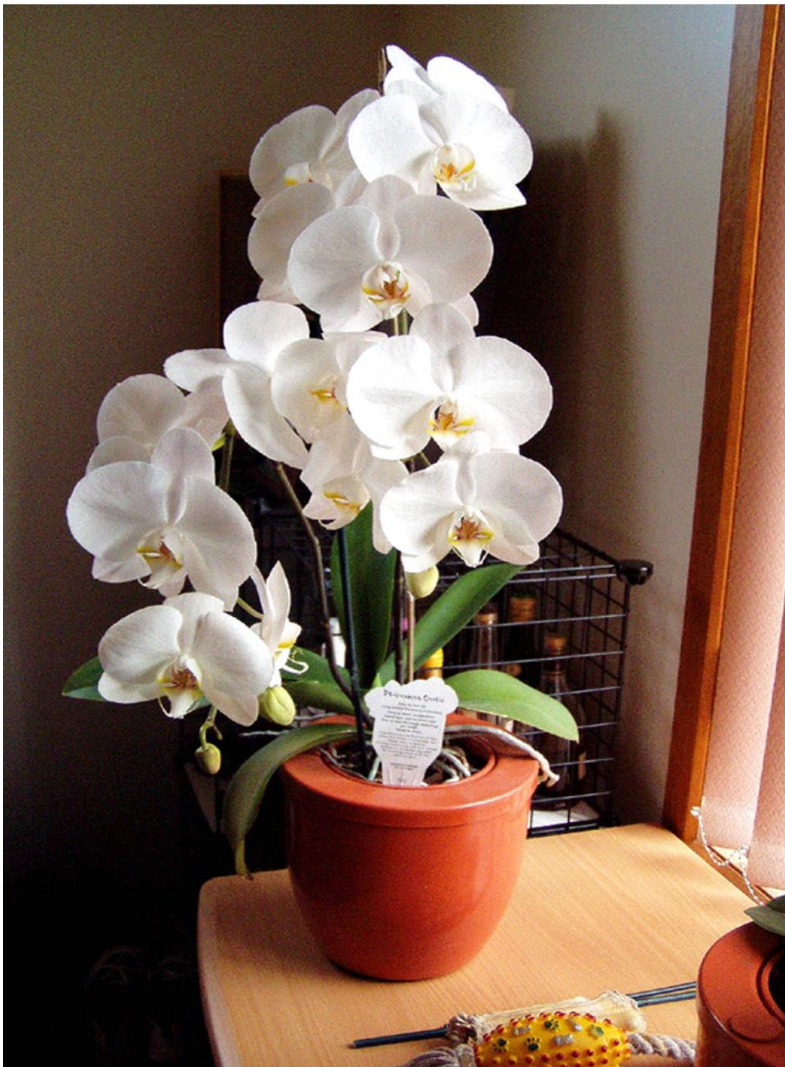
蘭花類與觀葉植物類的栽培令您得心應手