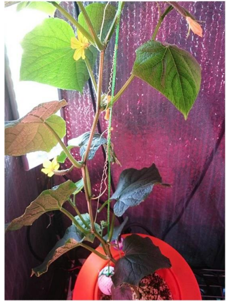
胡瓜等果菜類的種植勝任有餘